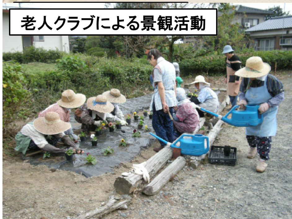
老人クラブによる景観活動