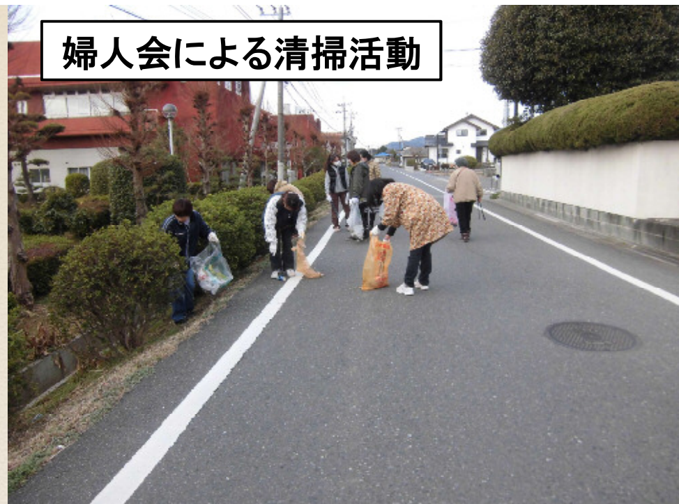
婦人会による清掃活動