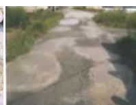
農道の窪みの補修