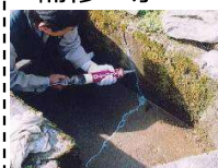
水路のひび割れ補修