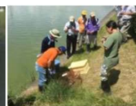
ため池の外來種駆除

実施主体：農業者等で構成される組織（①及び③は農業者のみで構成する組織でも取組可能） 対象農用地：農振農用地及び多面的機能の発揮の観点から都道府県知事が定める農用地